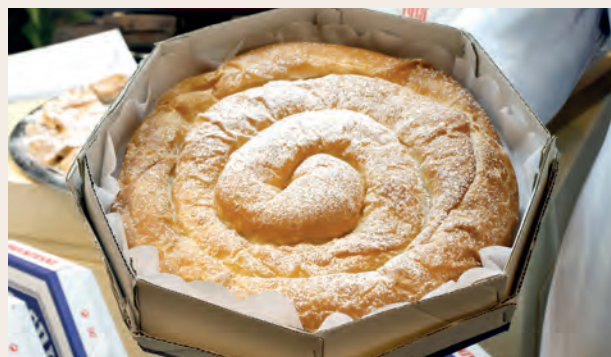
SERRA TRAMUNTANA-COSTA NORD