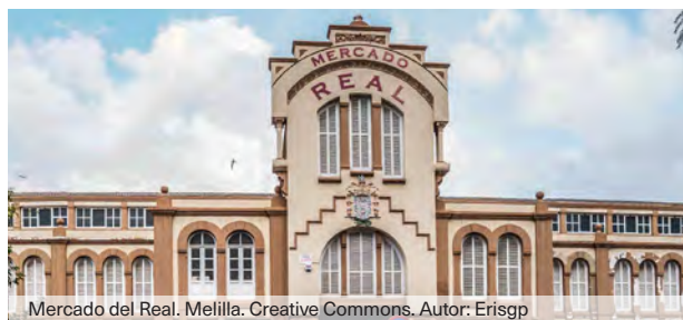
Mercado del Real. Melilla.