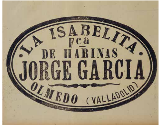
Harina LA ISABELITA Olmedo (VALLADOLID). [1900]. Papel grueso con tipografía en madera (xilografía). 32,5x42,5

Pero también, como casi siempre sucede, hubo resistencia a los avances, porque siempre ha habido gente para todo. Como muestra, un político de la época afirmó que era una vergüenza que la mujer