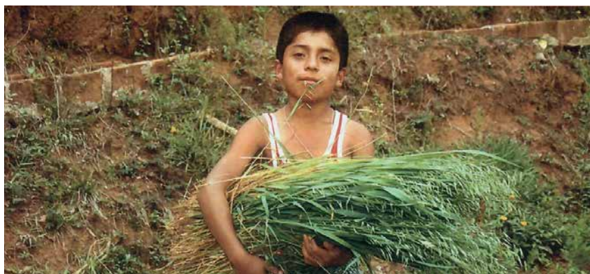
Niño con la cosecha de cereal realizada.

De modo muy reduccionista podríamos decir que hay dos grandes bloques de producir alimentos. El primer bloque sería el que se sigue en países desarrollados y, en algunos en vías de desarrollo, basado en estructuras económicas y búsqueda de rentabilidad que por mor de la globalización y, dado lo que suponen ciertos costes en la producción de los alimentos, en estos últimos países se invierte en el sector primario para obtener grandes beneficios, dada la baja inversión a realizar para generar empleo y, en definitiva, obtener una buena rentabilidad. El segundo bloque lo conformaría una mísera agricultura de