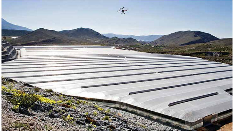
Dron sobrevolando invernaderos en el sureste de España.

con ciertas curiosidades en cuanto a la aparición de determinados residuos de plaguicidas en países concretos.