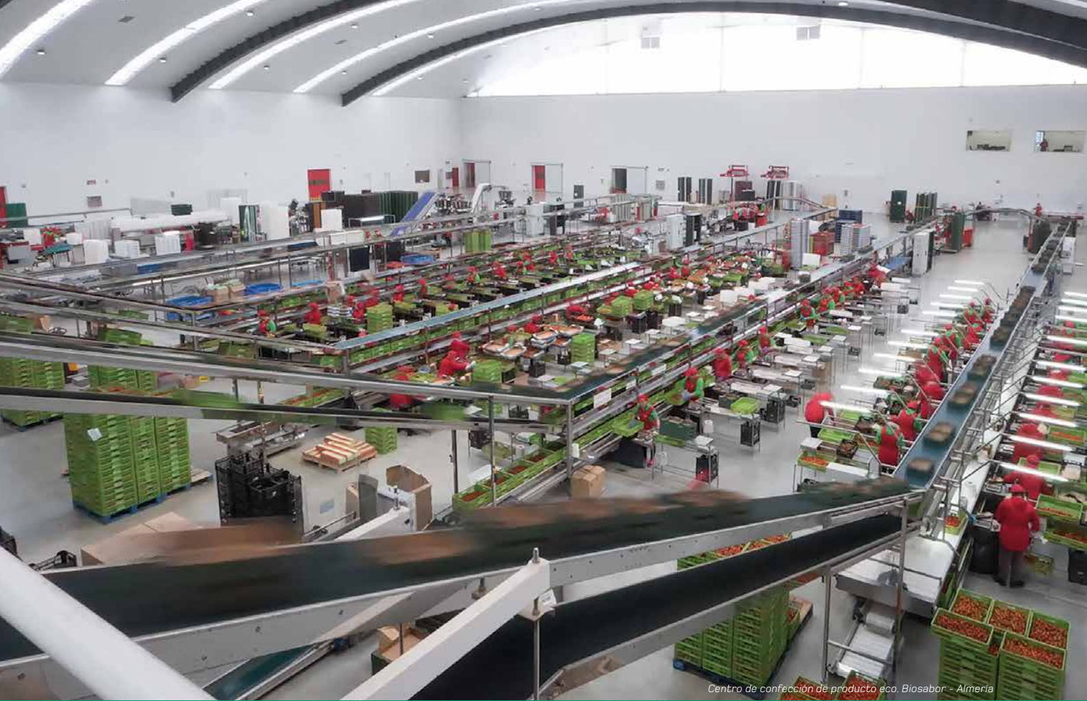
Centro de confección de producto eco. Biosabor - Almería