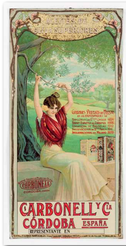
Aceite CARBONELL CORDOBA. Pere Abarca. [1920]. Chapa litografiada en relieve. 54,3x26,5.

Jerjes, muchos años después, aprovechándose de las circunstancias y de la colaboración de otras ciudades griegas que estaban hartos de que la Acrópolis impusiese sus leyes y se aprovechase mediante pillaje de la inferior capacidad bélica de los aliados, arrasó e incendió Atenas haciendo desaparecer casi todo, pero entre las ruinas y la desolación sobrevivió un árbol que estaba colocado ante el templo de Erecteión. Esa misma primavera floreció y seis lunas más tarde dio fruto. Por haber sobrevivido al incendio se le consideró símbolo de la fuerza, por su