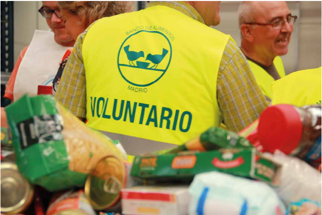
Fuente: Federación Española de Bancos de Alimentos

la actividad de todos los operadores que confluyen cada día en el mercado-productores, mayoristas y compradores- para dimensionarlo, analizar sus causas, explorar la percepción de los actores que participan y, finalmente, elaborar propuestas concretas de intervención para reducirlo y mejorar la operativa de gestión de los residuos orgánicos. En este estudio participan la Oficina de Medio Ambiente de la UAB, la empresa Spora Sinergias, una consultora especializada en el desarrollo y mejora de proyectos, programas y políticas sociales, y la Plataforma Aprovechamos a los Alimentos (PPA), una entidad sin ánimo de lucro que ha conseguido el apoyo de varios representantes de la cadena alimentaria y de la administración para luchar contra el despilfarro alimentario desde el campo a la mesa.