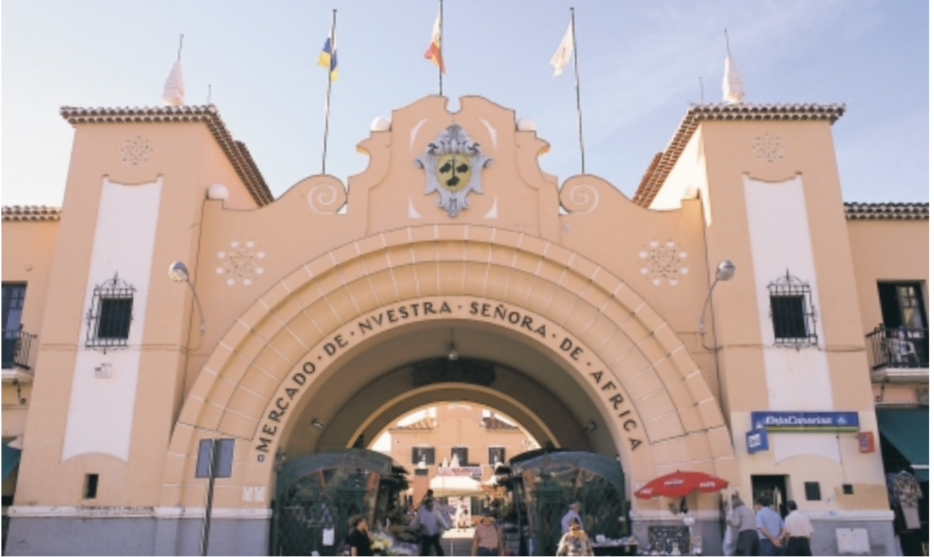
MERCADO NUESTRA SEÑORA DE ÁFRICA. SANTA CRUZ DE TENERIFE