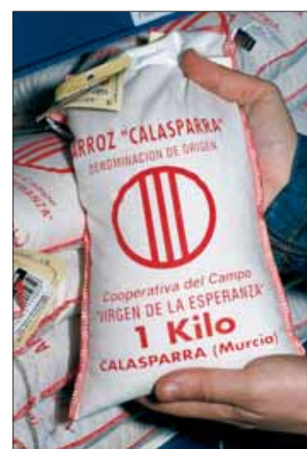
CUADRO Nº 1