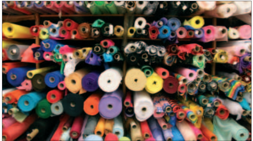
CUADRO Nº 2

Estos procesos han llevado consigo cambios notables en las estructuras del sector, afectando a las formas de distribución y comercialización (caracterizadas por una mayor concentración de la distribución), y a las pautas de localización en el territorio (una mayor concentración urbana de las grandes enseñas de distribución). Esto, a su vez, ha originado una evolución creciente de los canales de franquicia y de las cadenas sucursales e hipermercados, en detrimento de los minoristas independientes y de los almacenes populares. A pesar de la fuerte presencia en número de los detallistas tradicionales, su peso en el conjunto sectorial