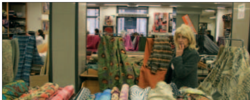
CUADRO Nº 3

Desde el 1 de enero de 2005 hay un nuevo escenario en el comercio mundial del sector textil-confección que de seguro tendrá importantes repercusiones en la industria y empleo español y europeo. Ha sido precisamente en esa fecha cuando se ha culminado la fase de la llamada liberalización total de los mercados textiles. A partir de ese momento, ya no existe ninguna barrera o limitación en cuanto a cantidades a importar de países en desarrollo por los países económicamente industrializados, de forma que las cantidades, los contingentes, las cuotas que estaban limitadas de una forma progresiva durante los últimos diez años desaparecen. Los primeros datos de 2005, proporcionados por el CITYC, apuntan incrementos de las importaciones textiles procedentes de China, que en enero alcanzaban hasta el 1.099% en vestidos en tejido o punto. Sin duda alguna este acontecimiento va a revolucionar el sector y afectar a los formatos comerciales debido a los cambios que se van a producir en cuanto a costes de fabricación,