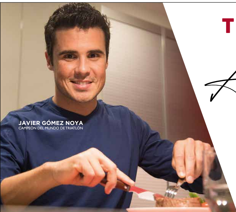
JAVIER GÓMEZ NOYA CAMPEÓN DEL MUNDO DE TRIATLÓN

Además, la presencia en ferias internacionales en las que se organizan, entre otras actividades, reuniones de negocio con potenciales importadores, es otra de las posibilidades que tenemos para dar a conocer el sector cárnico español en el exterior.