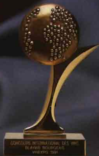
GRAN PREMIO DE HONOR Citadelles d'or VINEXPO - Francia 1.991

Más de 4.200 Bodegas concursantes, 20 Únicos grandes premios para todo el mundo. 4 Españoles 1 Real Irache Gran Reserva 1.973