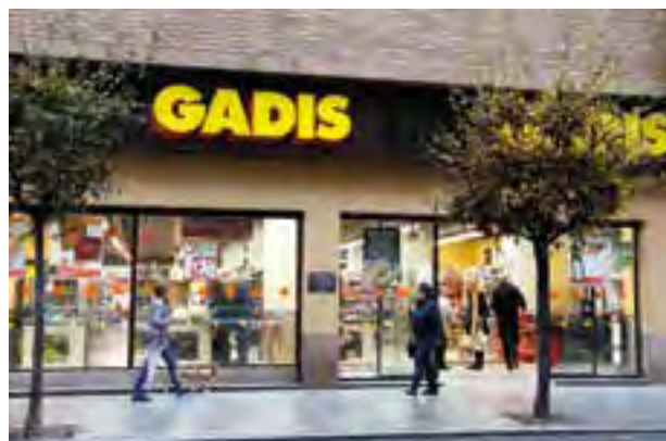
DISTRIBUCIÓN ALIMENTARIA EN GALICIA

En comparación con la media nacional, los consumidores de Galicia cuentan con un gasto superior en chocolates y cacao (28,6%), aceite (32,1%), pan (29,9%), leche (22,8%), frutas frescas (15,9%) y huevos (28,6%), mientras que, por el contrario, gastan menos en platos preparados (-33,2%), agua mineral (-22,2%), zumos y