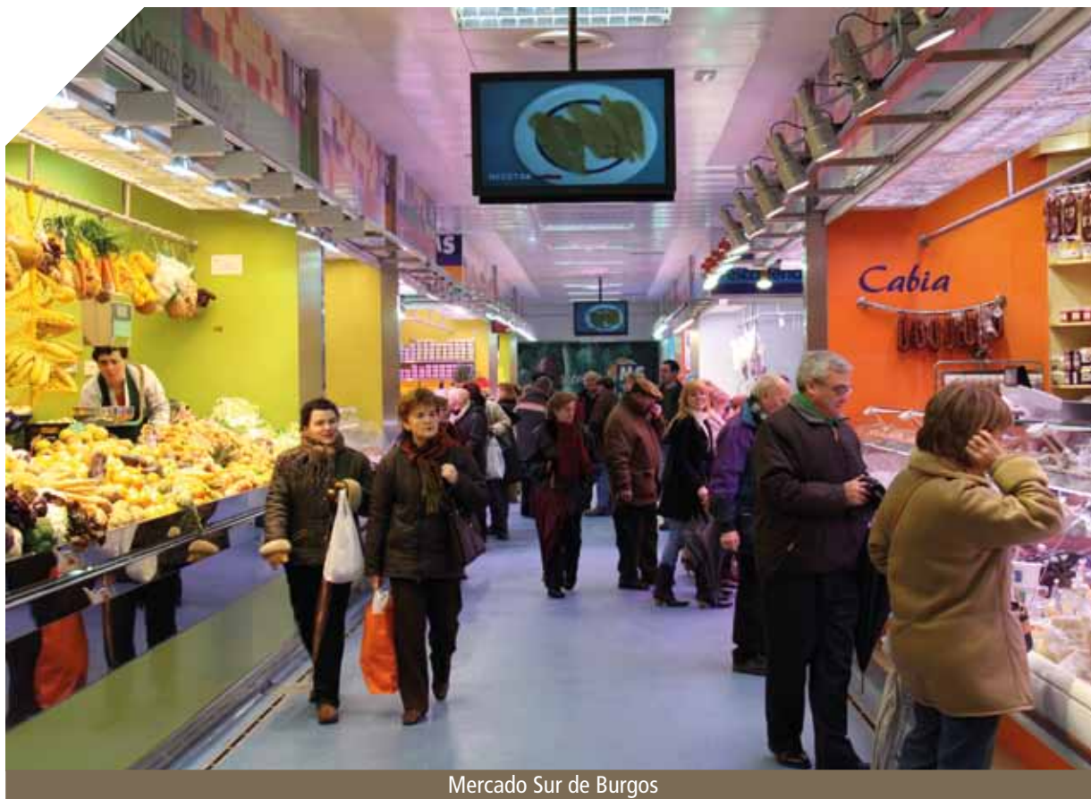
Mercado Sur de Burgos