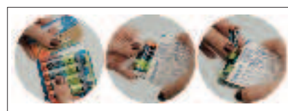
Foto 4.