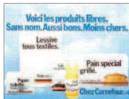
Foto 1. Publicidad de los productos libres en Francia, 1976.

Desde el año 2000, la cuota de mercado de las MDD no ha dejado de crecer en Francia impulsada por los grandes distribuidores para, por una parte imponer su poder de negociación a los industriales y, por otra, hacer frente a los establecimien-