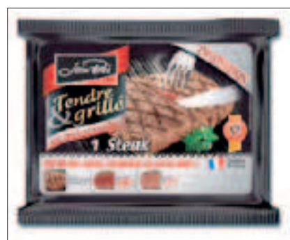
Foto 6.