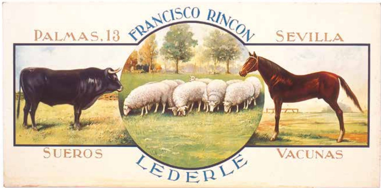
Sueros y vacunas FRANCISCO RINCÓN LEDERLE Sevilla. [1930]. Papel litografiado sobre cartón. 24,5 x 50,2.

La belleza contenida en este cartel de Sevilla se debe no solamente a la elegancia y simpleza de las imágenes recogidas (toro, caballo y rebaño de ovejas), sino también a que la belleza de ellas parece dejar eximido al ilustrador el tener que dar más explicaciones y textos.