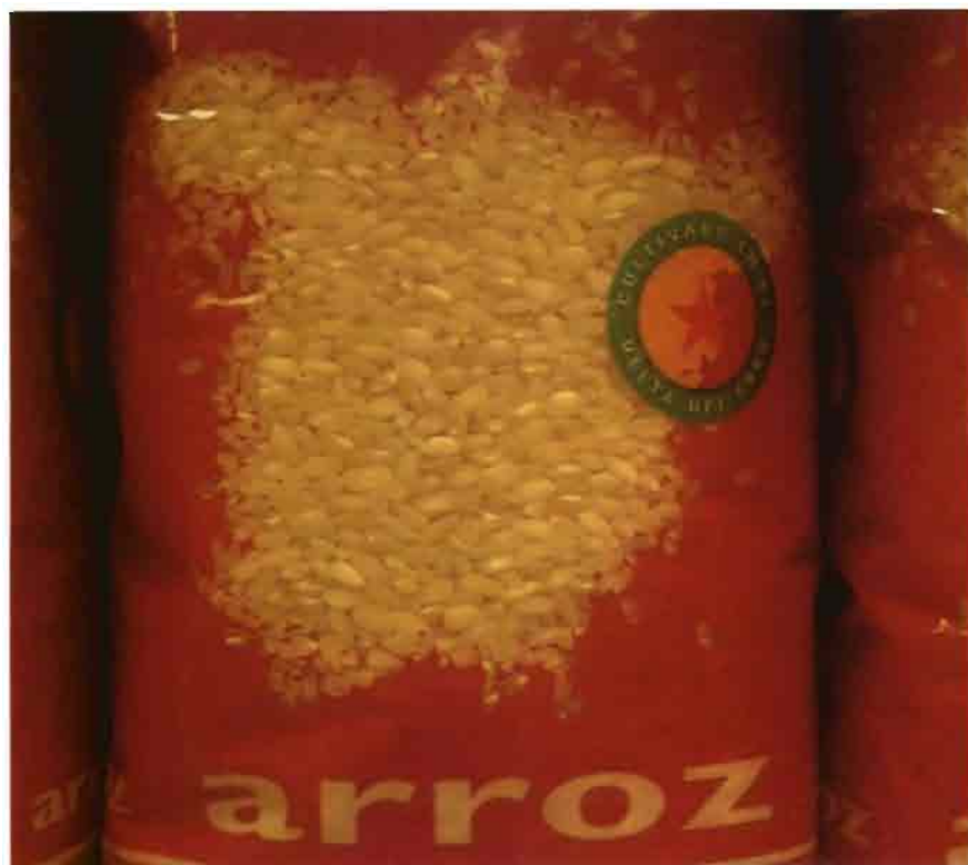
CUADRO Nº 8