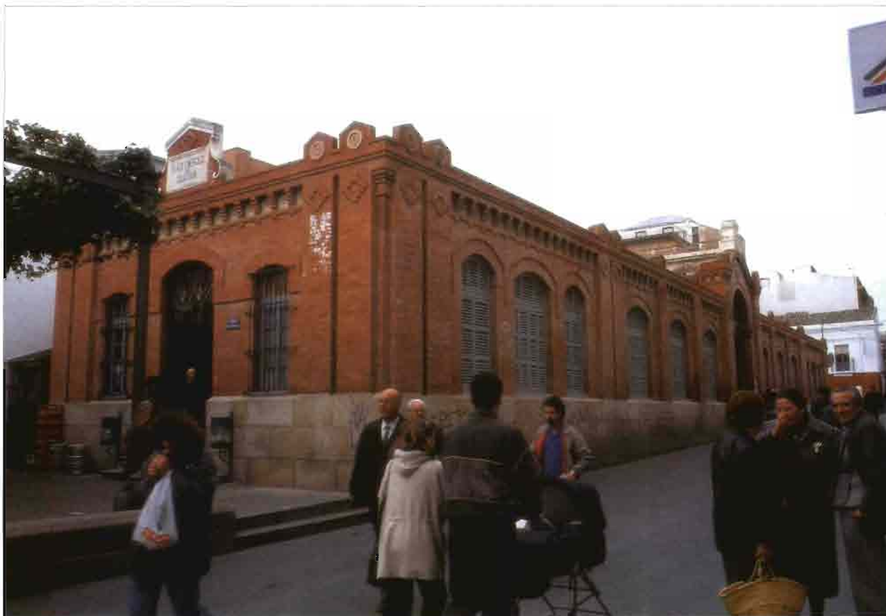
MERCADO DE CALATRAVA (MÉRIDA).