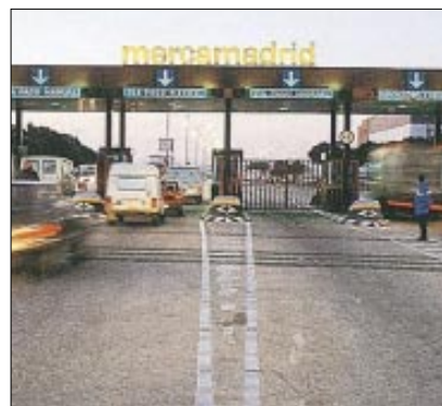
CUADRO Nº 12