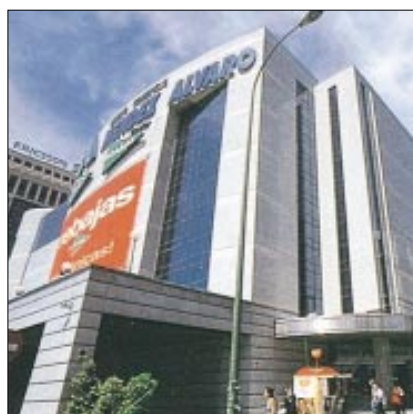
CUADRO Nº 19