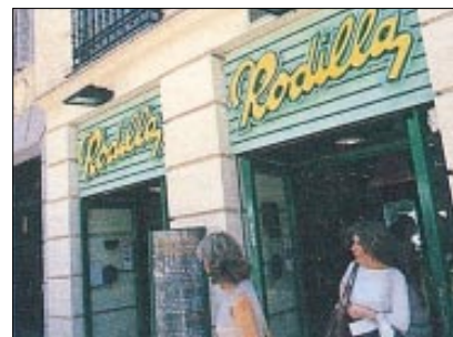
CUADRO Nº 22