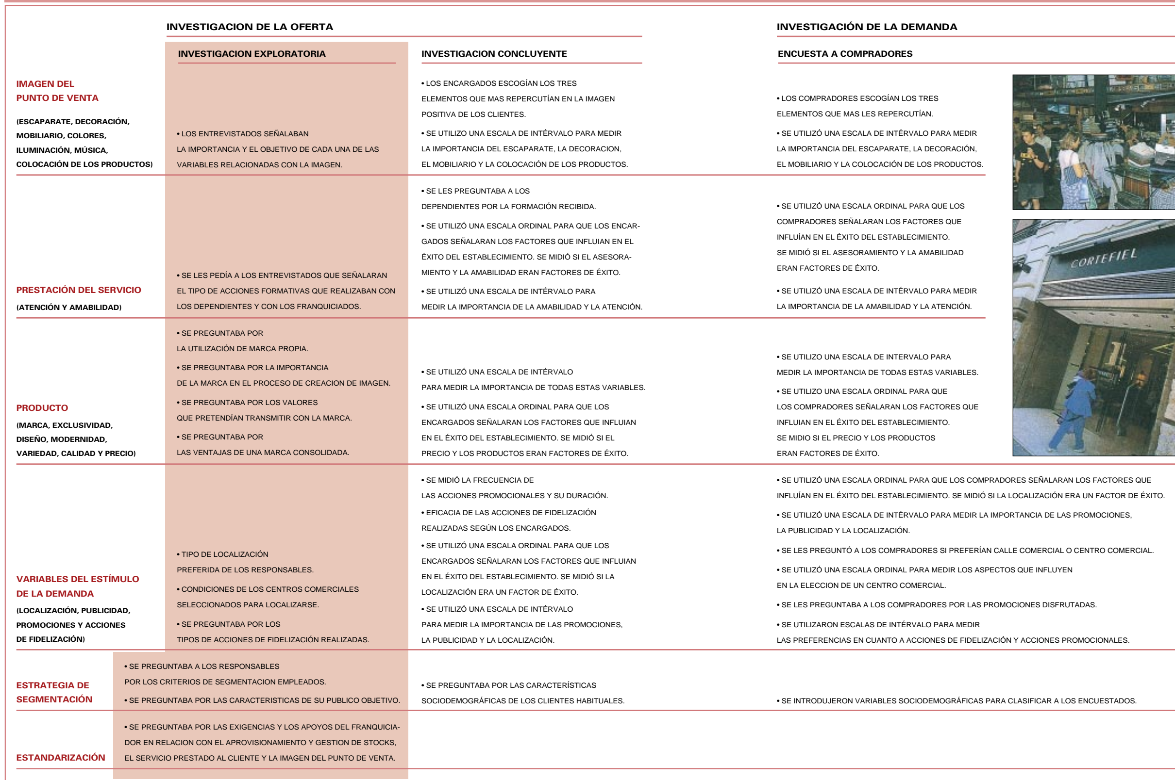
CUADRO Nº 2 MEDICIÓN DE LAS VARIABLES ANALIZADAS

tajas e inconvenientes que las cadenas comerciales señalaron para estas dos alternativas.