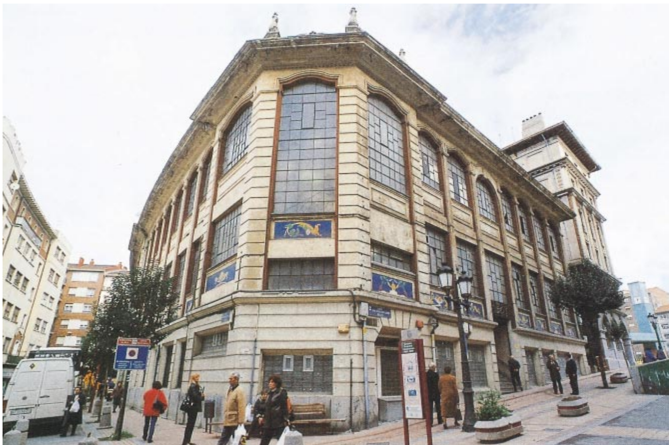
MERCADO MUNICIPAL DE BARAKALDO (VIZCAYA)