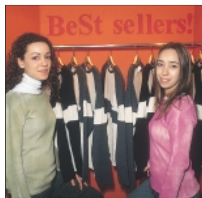
CUADRO Nº 2