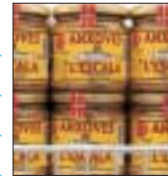
GRÁFICO Nº 1