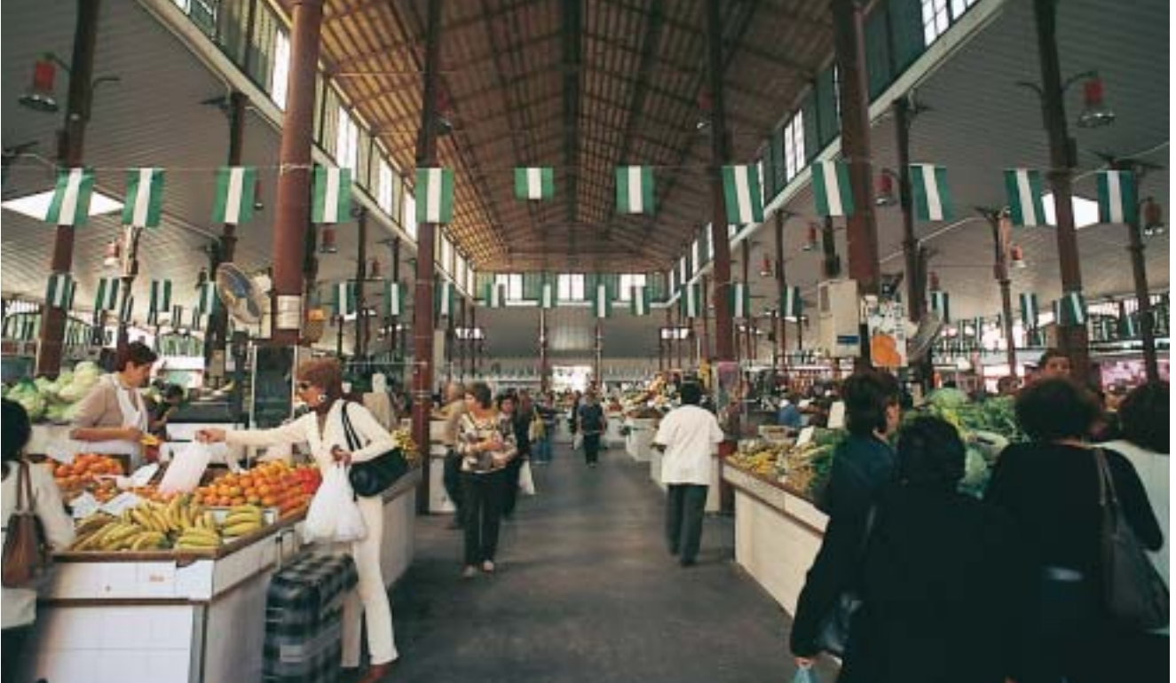
MERCADO CENTRAL DE ALMERÍA