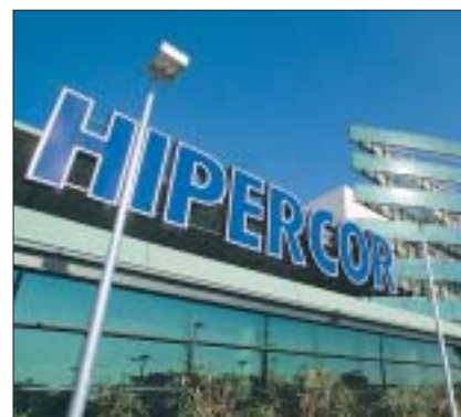
GRÁFICO Nº 1