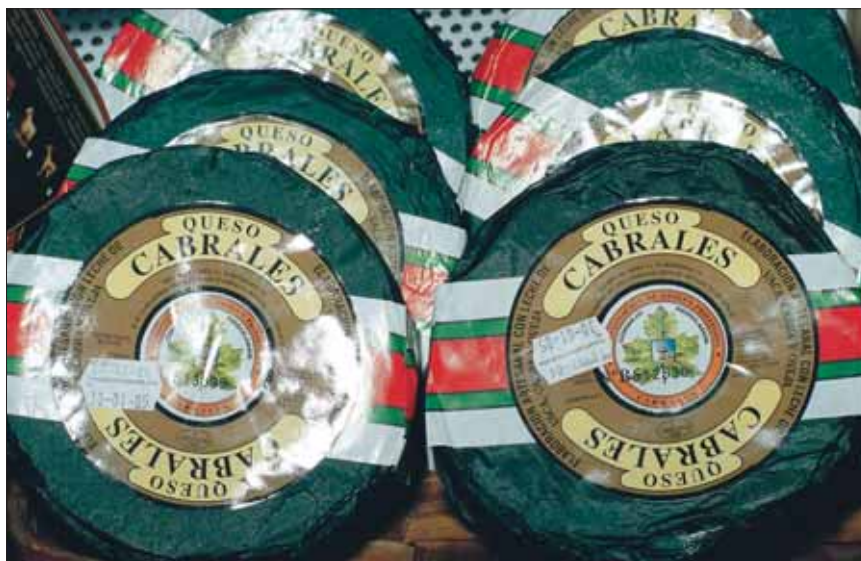
CUADRO Nº 4

En cuanto a los yogures y postres lácteos, hay que destacar también un espectacular incremento de las marcas de distribuidor en el último año (más de un 20%): uno de cada tres yogures o postres que se consume en España está etiquetado con marca blanca. En esta coyuntura, y teniendo en cuenta que Danone cuenta con una cuota de mercado del 50%, el resto de fabricantes se ven obligados a presentar productos innovadores que no estén en el catálogo del líder para seguir arañando posiciones. El eje de crecimiento se encuentra en los probióticos que, a pesar de llevar pocos años en el mercado, ya representan el 9% del volumen total.