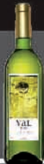
VAL DE PANIZA 2007/2008