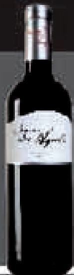
VAL DE PANIZA 2007/2008

PLATA Concurso Internacional de Madrid 2009