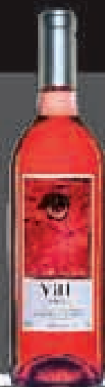
VAL DE PANIZA 2008/2009

GRAN PREMIO PANIZA PLATA Paniza Wine Label 2008 PLA. A los vintners Wine & Food Alliance Londres 2009