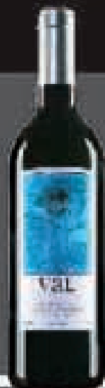
VAL DE PANIZA 2007/2008

GRAN PREMIO PANIZA PLATA Paniza Wine Label 2008 PLA. A los vintners Wine & Food Alliance Londres 2009