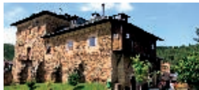
Palacio de Canedo. Cacabelos.