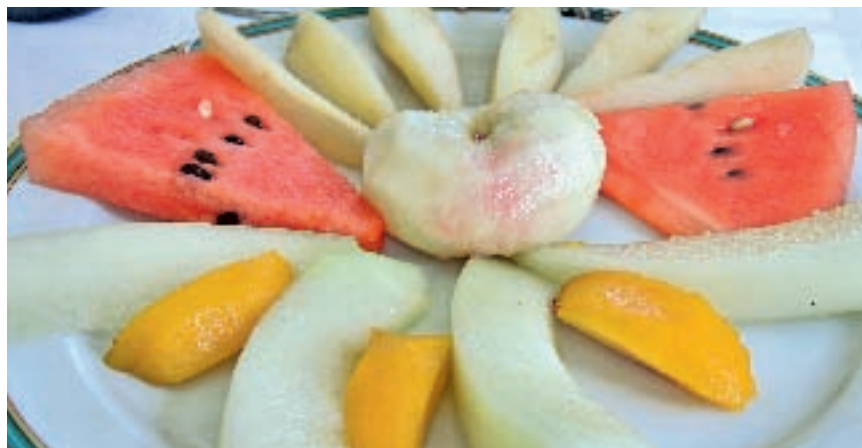
Fruta de Lérida. Restaurante Cal Nenet.

más de las veces se anuncian con una tímida mención "frutas del tiempo", y si se pide, hay que averiguar previamente de qué fruta se trata, pues son muchos los que sólo ofrecen una especie en lugar de presentar un lucido frutero. Las frutas, es cosa sabida, aun siendo de la misma especie, difieren mucho según la variedad de la que proceden y, no obstante, mientras que en todo restaurante hay una carta de vinos en la que éstos se separan por bodegas y marcas, ni por casualidad se encuentra un restaurador que ofrezca manzanas, peras u otras frutas anunciando sus distintas variedades como si no mediara un abismo de sabor de unas a otras. Pero ésta es una cuestión que no les preocupa, y si se les interroga sobre la carencia de una oferta seria de frutas, se limitan a contestar: "No las pide el cliente". ¿Por qué no pide el español frutas? Por la escasa calidad de la oferta.