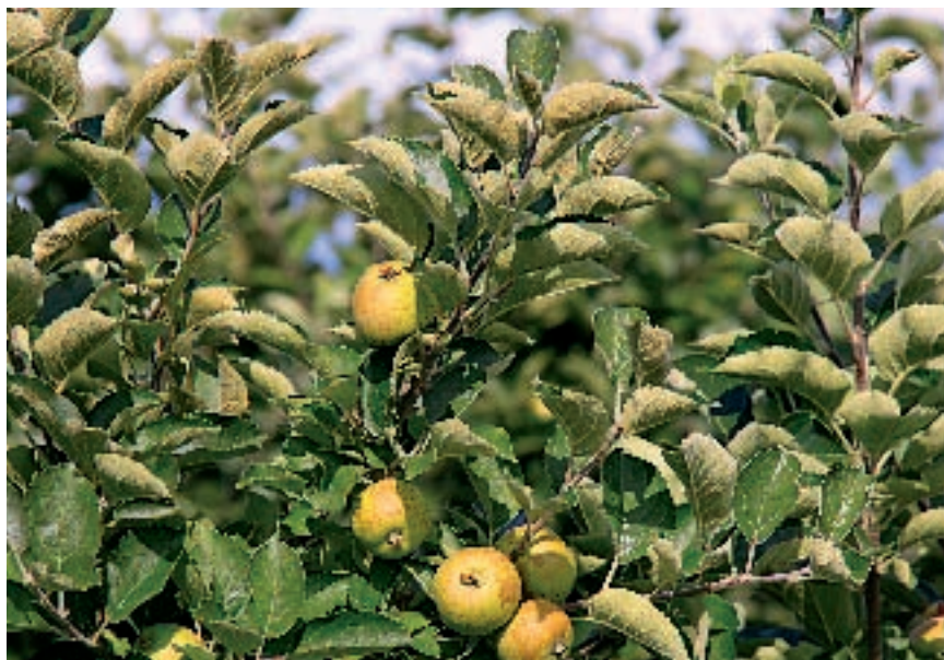
Manzanas de El Bierzo.

China, Ecuador y Costa Rica, mientras los mayores compradores son Estados Unidos, Alemania, Francia, Reino Unido, Bélgica y Holanda. Sin embargo, Asia es el continente que produce la mitad de la fruta mundial, que destina en gran parte al consumo interno; América produce en torno al 20%, aunque exporta un 70% de sus recolecciones, mientras Europa tiene una producción de sólo el 16% y compra fuera el 50% de lo que consume. En África cabe destacar la producción de Uganda, que supone un 2,6% de la producción, según datos de un estudio realizado por Martínez de León y De Miguel Gómez en la Universidad Politécnica de Cartagena.