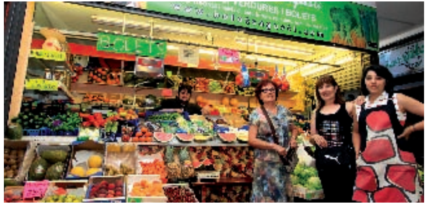
Mercado Ronda Fleming. Lleida.

menesteres es, naturalmente, Lleida , capital agrícola de Cataluña. Zona de embutidos autóctonos, como el solís , curioso y exquisito salchichón, y la girella , a base de tocino, arroz, huevos, ajo, perejil, azafrán, sal y pimienta; del queso Tupí , fermentado de leche de oveja, y de los vinos DO Costers del Segre. Platos donde brillan los caracoles, el arroz con conejo , las cocas , especialmente la pallesca , la cassolada , los panadones y el confitat . También hay que prestar atención a los platos de caza, especialmente a los que se hacen con isad, rebeco del Pirineo. Si la visita se hace entre los meses de septiembre y octubre hay que acudir prestamente a las Semanas Gastronómicas de la fruta, en las que distintos restaurantes elaboran platos con estos productos.