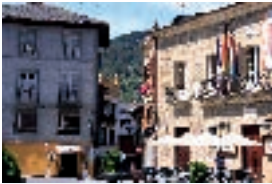
Villafraanca del Bierzo.