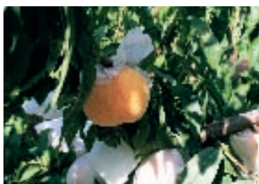
Melocotones de Calanda. Teruel.