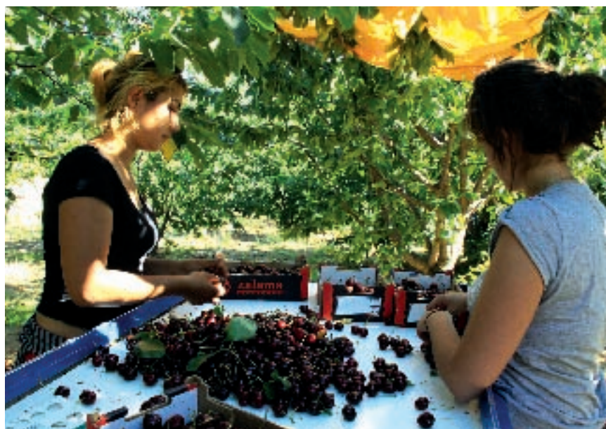
Seleccionando cerezas en el Jerte.

Las cerezas y las guindas son muy populares en toda España y si hace algunos años estaban destinadas a ser única y exclusivamente frutas de verano, ese concepto ha cambiado y hoy, gracias a las importaciones, especial-