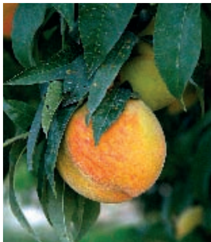
Melocotonero en Murcia.

A medida que la fruta se fue trasladando al final de la comida, su importancia y valor fueron cediendo posiciones y acabó tristemente orillada en el menú. En España, aún a pesar de la abundancia en producción total y de la enorme variedad de especies y variedades, como señala Lorenzo Millo: "...la oferta de frutas en los restaurantes bien puede merecer la clasificación de desastrosa. Las