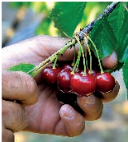
Recogiendo picotas en el Jerte.

E l camino y la excursión empiezan en el norte de la provincia de Cáceres, con un recorrido que siempre deberá ser largo y reposado, para gozar y maravillarse del paisaje, la gastronomía y el trato gentil de las gentes de los valles del Jerte, La Vera y Ambroz, ámbito natural de una de las grandes cimas frutícolas españolas, la cereza del Jerte , en gran parte picotas, cereza sin pedúnculo, de los tipos Ambrunés , Pico Negro , Pico Colorado y Pico Limón Negro , junto a la exquisita cereza con rabo que llaman Navalinda. Como centro de operaciones hay que elegir, sin la más mínima duda, Plasencia , ciudad fundada por Alfonso VIII para: "... agradar a