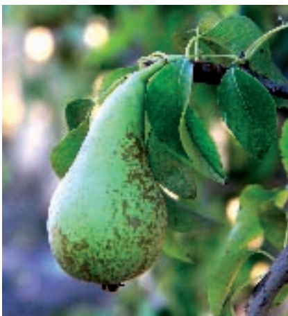
Perales de Lleida.

Lugar de referencia y prudencia para tales