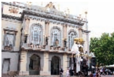
Museo Dalí. Figueres.