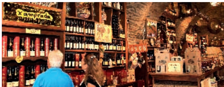
Tienda de Prada a Tope. Cacabelos.

Hacia el noroeste de la provincia de Burgos, donde se enclava la hermosa comarca y el Valle de Caderechas, entre la Sierra de Oña y el Páramo de Masa, con bosques, arquitectura popular de madera, piedra y adobe, y extensiones de frutales entre los que brillan con luz propia la cereza de Las Caredechas y la manzana reineta de Las Caredechas . Espacio para recorrer con calma, y reposando la vista a cada instante. A la hora del condumio, podría ser una elección sensata dejarse caer por la Fonda Once Brutos , de Oña , donde dan cosas ricas como cordero asado, ternera en su jugo y dulcería a base de la jugosa fruta local. ■