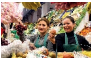
Mercado de Denia. Alicante.

El periplo empieza en El Bierzo, al norte de León, región repleta de magia y encanto que conviene recorrer mientras se escucha un himno, Quiero perderme otra vez en El Bierzo , del dúo Miguel y Edith , y donde se dan tres frutos de notable calidad e interés: la manzana reineta (en sus variedades blanca y gris) del Bierzo , macizas y estupidamente equilibradas en dulzor y acidez; la castaña del Bierzo y la pera conferencia del Bierzo . Punto de partida en la capital política y económica de la región, la medieval Ponferrada , antigua Pons Ferrata , en la confluencia de los ríos Sil y Boeza y en vecindad con dos joyas naturales: el Valle del Silencio y Las Médulas, impresionante paisaje de viejas minas romanas que son Patrimonio de la Humanidad.