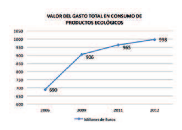
GRÁFICO 2 Distribución de la producción ecológica por tipo de origen

Entre 2006 y 2012 el valor del gasto total en productos ecológicos se ha incrementado en un 44,6% y en el período 2000-2012 el mercado interior se ha multiplicado por seis, a pesar de lo cual sigue estando insuficientemente dimensionado, muy por debajo de lo que le correspondería en función del potencial productivo existente, aunque no son de despreciar situaciones de ligero crecimiento en un contexto socioeconómico de gran dificultad.