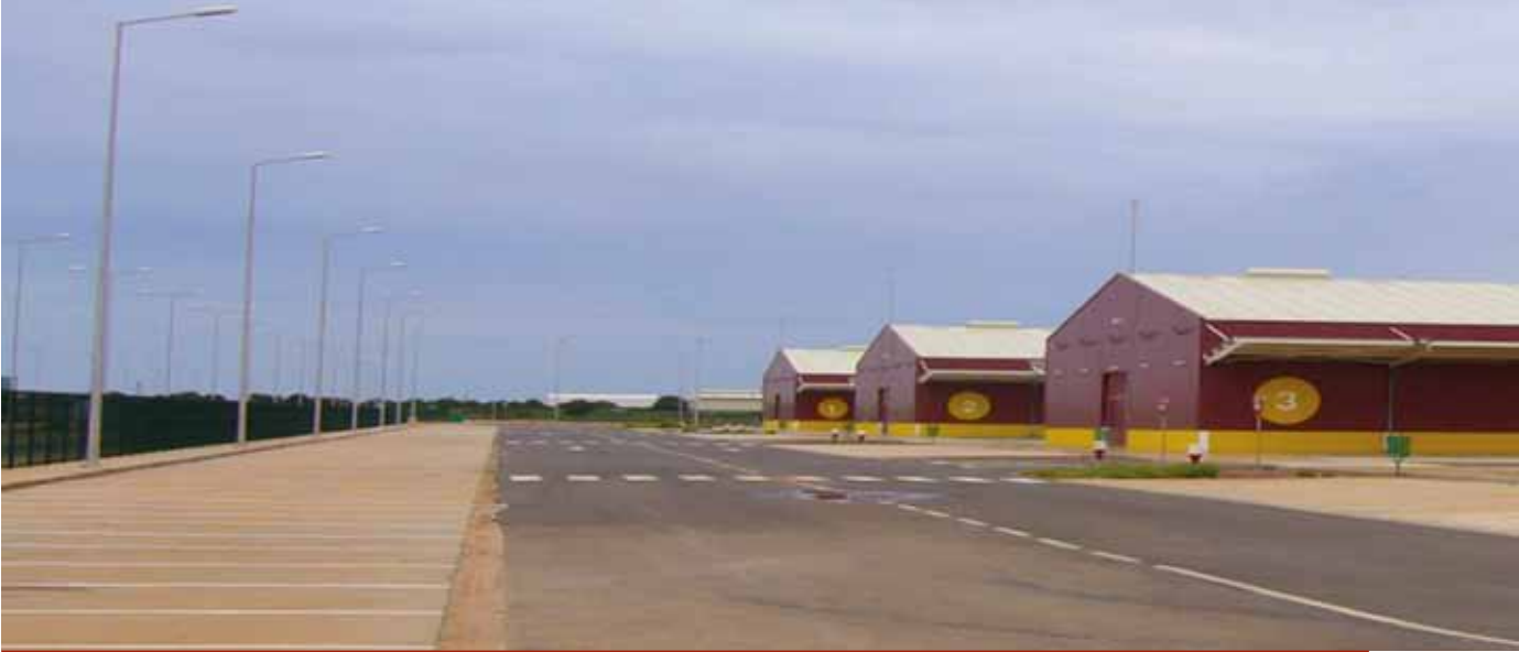
Cuatro naves del CLOD-Luanda (Angola)