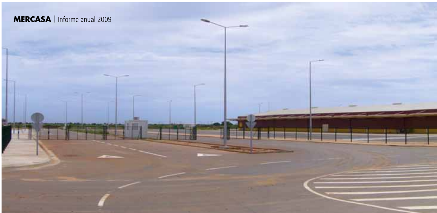
Cuatro naves del CLOD-Luanda (Angola)